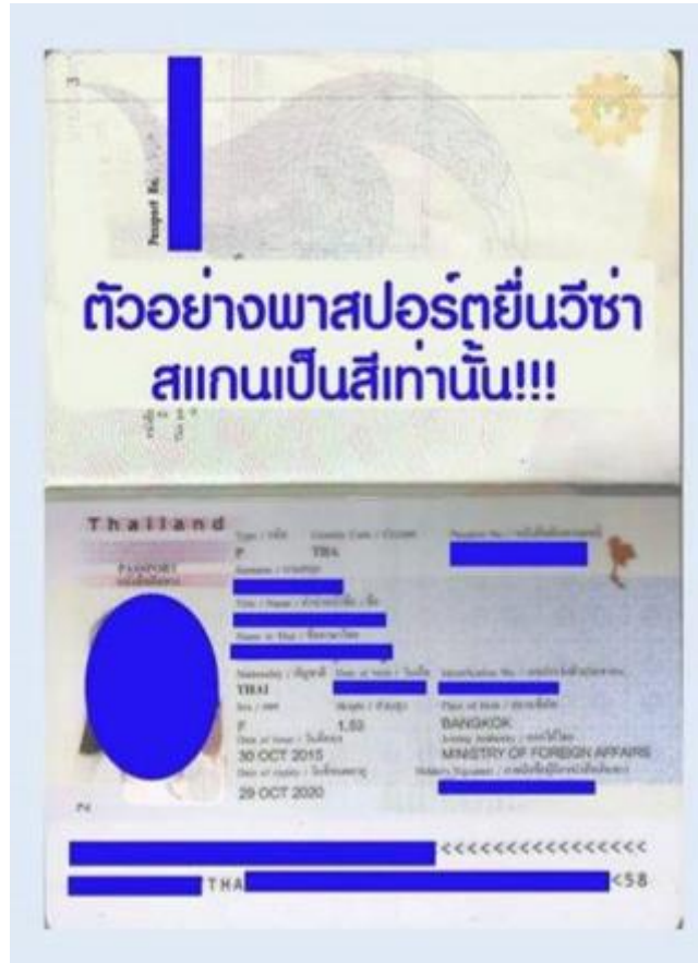
ตัวอย่าง