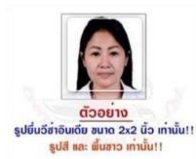
ตัวอย่าง